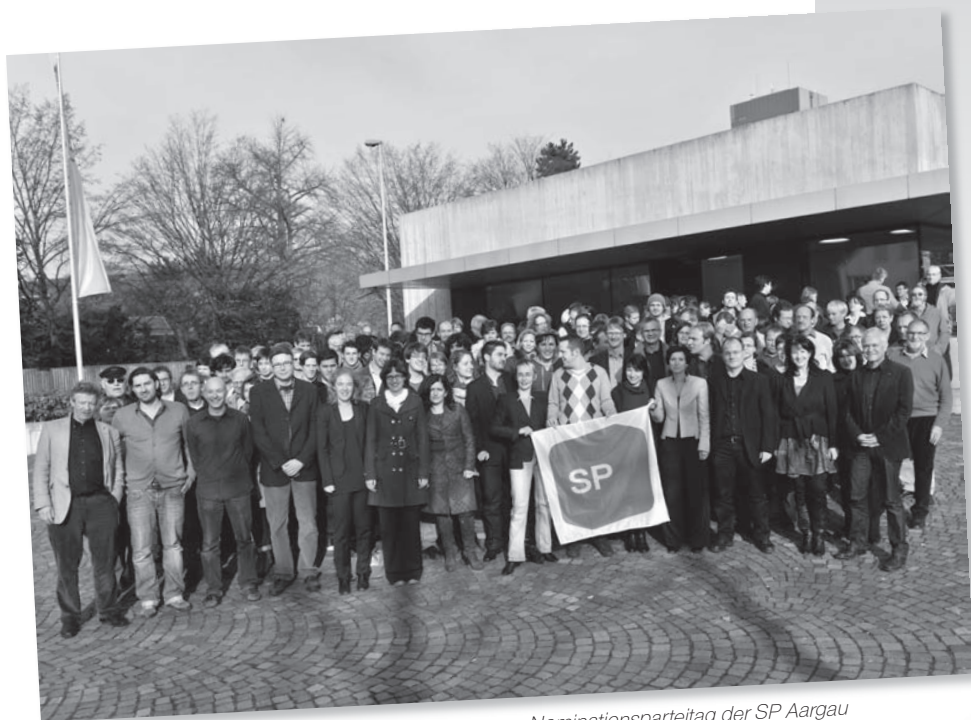
Die Delegierten der SP Kanton Aargau am Nominationsparteitag der SP Aargau für die Nationalratswahlen (20. November 2010 in Aarau).