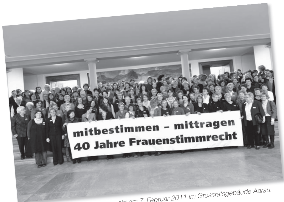
Jubiläum 40 Jahre Frauenstimmrecht am 7. Februar 2011 im Grossratsgebäude Aarau.