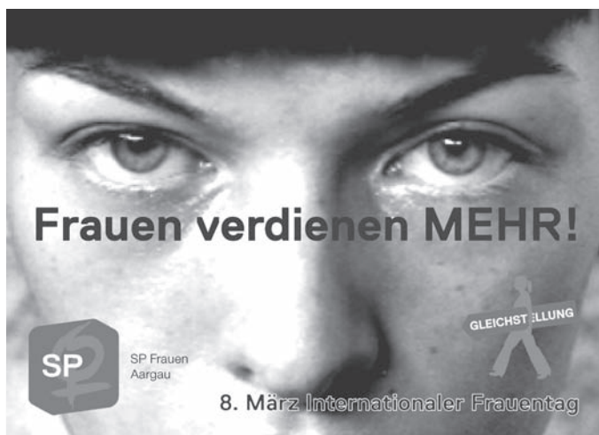
Flyer der SP Frauen Aargau zum internationalen Frauentag 2010.