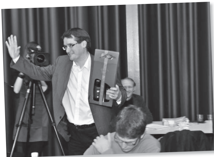
Christian Levrat am Nominationsparteitag der SP Aargau für die Nationalratswahlen (20. November 2010 in Aarau).

Kein Wahljahr! Daher konzentrierten wir uns wieder etwas mehr auf die Zukunft unserer Sektionen. Ein Werbeanlass anfangs Jahr in Kaisten zeigte auf, dass wir hier Handlungsbedarf haben. Unser Bezirk setzt sich zusammen aus der fast unüber-