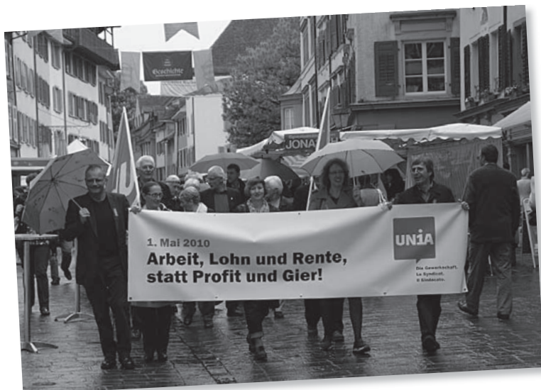
1. Mai-Umzug 2010 in Rheinfelden.

Im Jahr 2010 wirkte der Fachausschuss Justiz und Polizei an drei Vernehmlassungen mit.